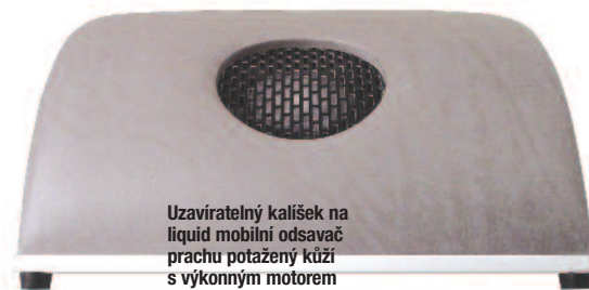
Uzavíratelný kalíšek na liquid mobilní odsavač prachu potažený kůží s výkonným motorem od Trosani.

neustálý spasmus mají za následek bolesti prstů, zápěstního kloubu, šlach, úponů. Na rovnou pracovní plochu stolu si určitě položte mobilní podložku pod ruku klientky ve tvaru půl válce, nejlépe omyvatel-