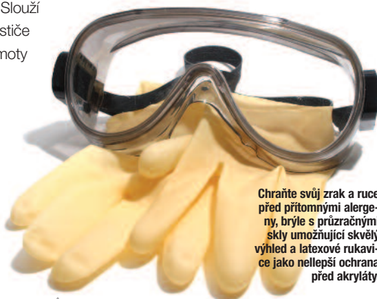
Chraňte svůj zrak a ruce před přítomnými alergeny, brýle s průhlednými skly umožňující skvělý výhled a latexové rukavice jako nellepší ochrana před akryláty.

●● Bolesti zad, kdo by je neznal... Ideální je mít svůj preventivní program pro denně namáhaná záda a krční páteř včetně cviků na protahování prstů a skutečně jim věnovat čas stejně jako pauzám k jiným protažením během pracovního dne. Potíží můžete předcházet vhodnou výškou a šířkou manikérského stolu, dostupností pomůcek a přípravků, ergonomickou židli s regulací opěradla s přitlakem na záda a bederní oporou. ■