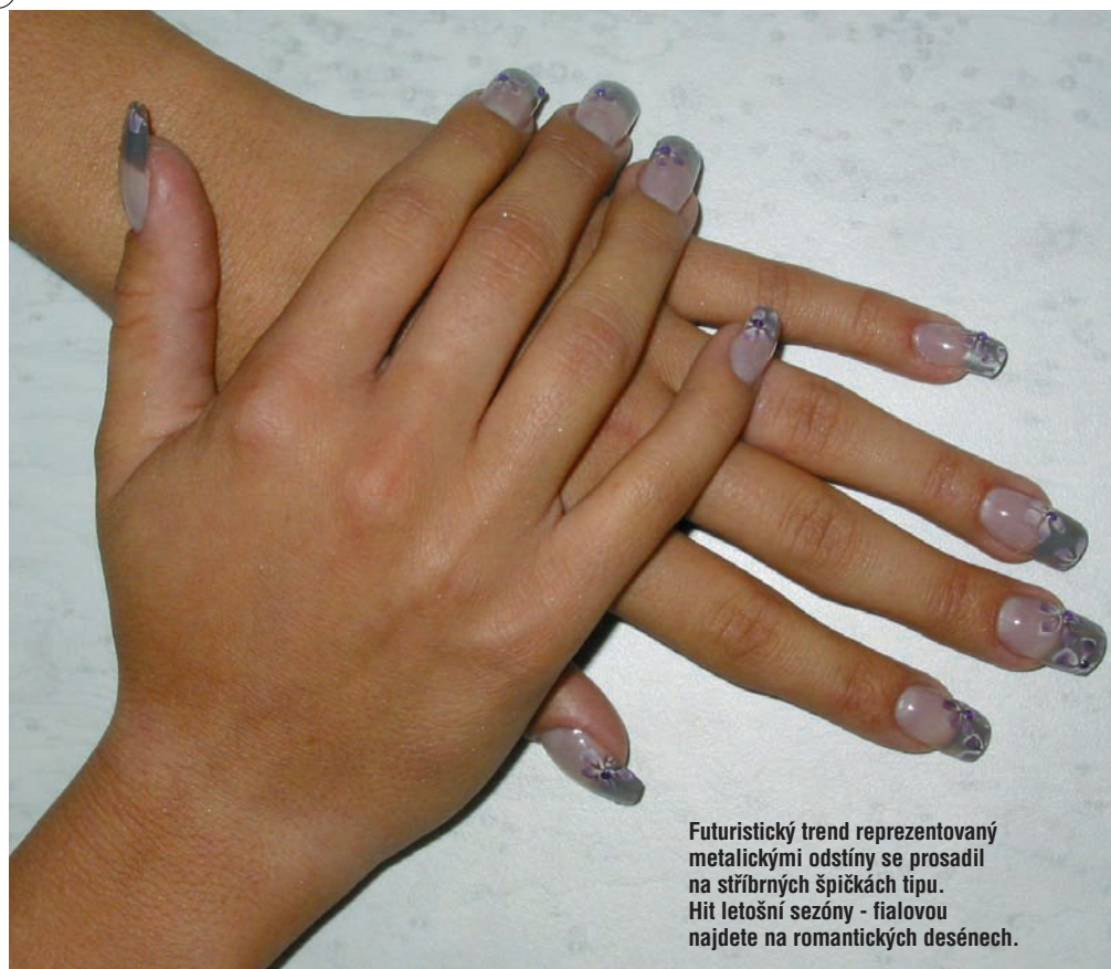
Futuristický trend reprezentovaný metalickými odstíny se prosadil na stříbrných špičkách tipu. Hit letošní sezóny - fialovou najdete na romantických desénech.